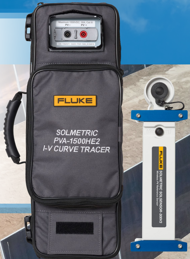
Abbildung der Kits auf der Rückseite

Indem wir den Kennlinienschreiber PVA-1500 mit leistungsstarken Fluke Strommesszangen, Multimetern, Wärmebildkameras und Isolationswiderstandsmessgeräten sowie Schulungen auf Abruf und Fluke Premium Care bündeln, können wir Solartechnikern, insbesondere im Bereich der Energieversorgung, jetzt einen noch größeren Vorteil bieten.