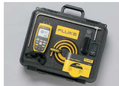
Fluke 922 Kit

Datenspeicher: 99 Messwerte Abmessungen HxBxT: 17,5 cm x 7,75 cm x 4,19 cm Gewicht: 0,64 kg Batterie: Vier Batterien Typ AA Batterielebensdauer: 375 Std. ohne Hintergrundbeleuchtung, 80 Std. mit Hintergrundbeleuchtung Zwei Jahre Gewährleistung