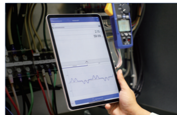
Step 2: Start the app installed to wirelessly connect the terminal with the instrument.